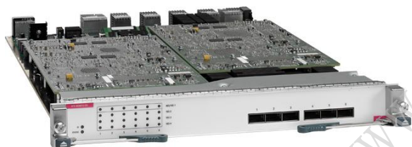
图 1. 带 XL 选项的 Cisco Nexus 7000 M2 系列 6 端口 40 千兆以太网模块

Cisco Nexus 7000 系列交换机是思科® 统一交换矩阵的基础。该系列是一个模块化数据中心级产品系列，专为可高度扩展的万兆以太网而设计。该交换矩阵架构的速度能扩展至 15 TB/秒 (Tbps) 以上，可支持高密度 40 和 100 千兆以太网部署。为满足大多数任务关键型网络环境的要求，这些交换机可持续提供各种系统运行和虚拟化服务。Cisco Nexus 7000 系列以业界认可的思科 NX-OS 软件操作系统为基础，具备多种强化功能，凭借出众的可管理性和适用性来完成实时系统升级任务。软件统一交换矩阵的创新设计专用于支持将 IP 和存储网络整合到单一无损以太网交换矩阵之上。